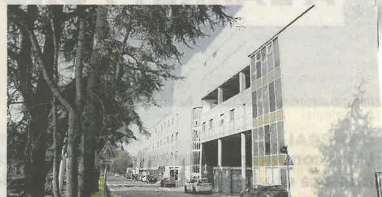
Si les vaccins n'arrivent pas davantage en nombre, la Clinique Sainte-Marie préfère ne pas rouvrir son centre de vaccination.

Les trois établissements en question sont les deux hôpitaux de Cambrai et du Cateau, et la Clinique du Cambrésis. ■ B. D.