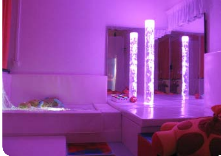
Espace Snoezelen (salle multi-sensorielle)