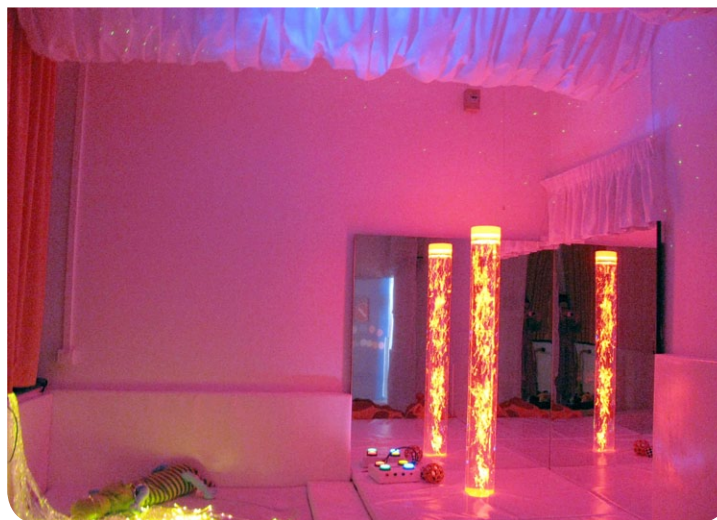
Espace Snoezelen (salle multi-sensorielle)