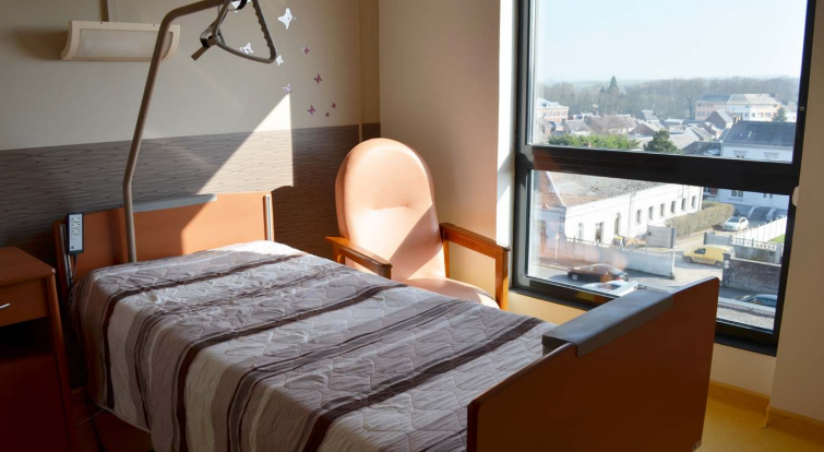
Chambre témoin de l'Unité d'Hébergement Renforcée